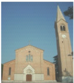
SANTA FOSCA VERGINE E MARTIRE RONCADELLE