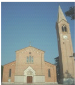
SANTA FOSCA VERGINE E MARTIRE RONCADELLE