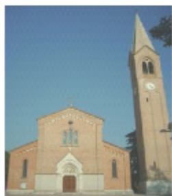
SANTA FOSCA VERGINE E MARTIRE RONCADELLE

Signore Gesù liberami! La pietra del sepolcro del mio cuore è ancora chiusa. Illuminami perché possa comprendere e vivere la bella notizia della Resurrezione! Amen