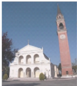
SAN BARTOLOMEO APOSTOLO ORMELLE