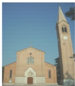
SANTA FOSCA VERGINE E MARTIRE RONCADELLE