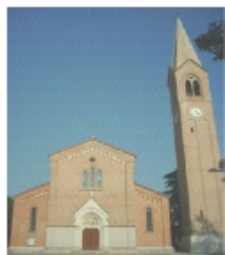
SANTA FOSCA VERGINE E MARTIRE RONCADELLE