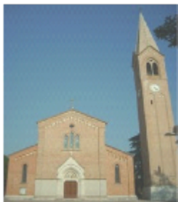
SANTA FOSCA VERGINE E MARTIRE RONCADELLE